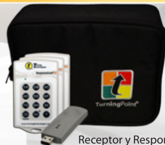
Receptor y ResponseCard del estudiante