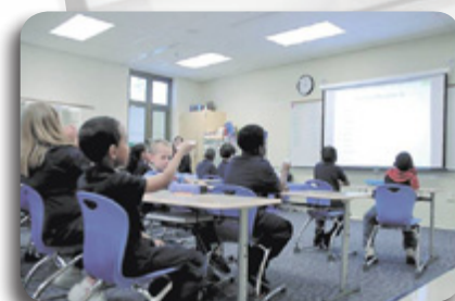
Estudiantes del centro E.J. Brown involucrados en el aprendizaje.