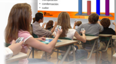
Estudiantes respondiendo a una diapositiva de sondeo interactivo con teclados ResponseCard®.