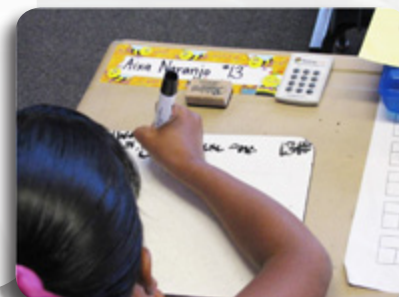
Herramientas del programa "10-A-Day" (10 preguntas al día) del colegio Sixth Street Prep